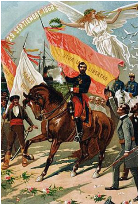
Fig. 1. Alegoría Revolucionaria La Gloriosa. Acceso 18-11-2023.

Six-year democratic term, The Glorious Revolution, Democratic monarchy, First Republic, Independent canton.