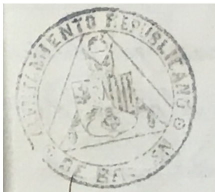
Fig. 5. Nuevo Sello del Ayuntamiento republicano de Bailén.