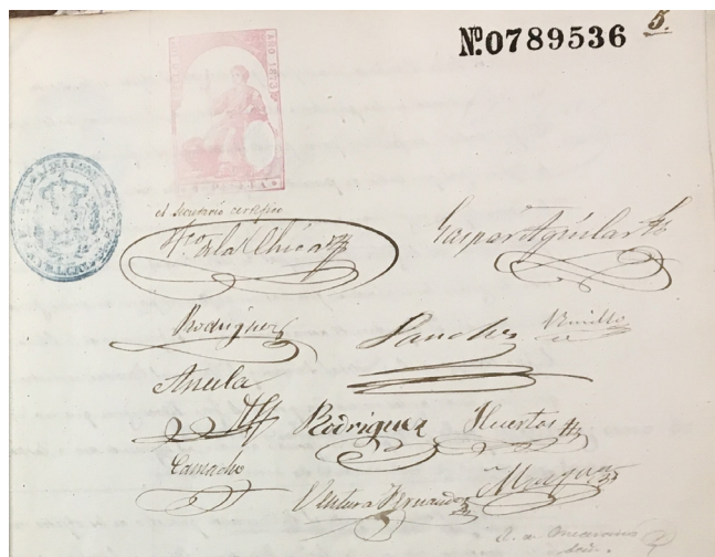
Fig. 3. Firmas de alcalde y concejales.

para cubrir las vacantes de médicos. Se creaba una plaza de médico titular de 1ª clase que estaría desempeñada por dos profesores de medicina y cirugía. En las bases se recogía que el término municipal de Bailén según el último deslinde jurisdiccional abarcaba “al norte 5 km, al sur 6 km, al este 6 km y al oeste 3 km”. La población según el último empadronamiento general era de unos diez mil habitantes y una parte de población flotante de transeúntes que tenía su caserío concentrado en unas veinte viviendas equidistantes de la cabeza del término como una media hora. En el reglamento para proveer las plazas de médicos titulares se recogía que los médicos contratados deberían prestar asistencia facultativa a 300 familias pobres según el listado anual presentado por el Ayuntamiento. Los facultativos tendrían un sueldo de 1500 pts. anuales y deberían residir en la localidad. 26