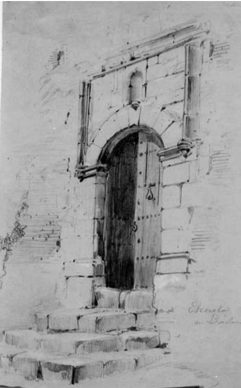
Fig. 6. Portada escuela de Jesús.

provincia D. Francisco Muñoz y Andrade, vino en visita a esta población y no encontrando local a propósito para el establecimiento de una escuela pública, solicitó del obispo cediera la ermita con dicho fin a la municipalidad, lo cual fue otorgado, pero de manera interina hasta que el Ayuntamiento habilítase otro lugar para ella. Por la ley desamortizadora de 1841 la Hacienda se incautó de la casa y santuario de Jesús. La primera la vendió en subasta y el segundo lo respetó por el objeto a que estaba destinado, pero por más que el comprador de la casa alegara derecho al gran corralón de la ermita este no le corresponde, pues es