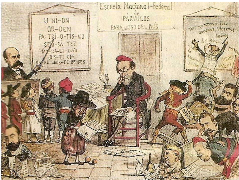
Fig. 2. Primera república española La Flaca. Acceso 18-11-2023.

Al principio de 1869 se llevaron a cabo una serie de actuaciones por parte del Partido Republicano Federal para afianzar la organización del partido que