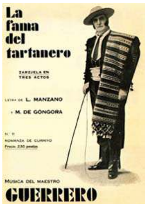
Fig.5. Portada del libreto (Fuente: http://la-zarzuela.webcindario.com ) [Actualizada el 15/05/2013]. Acceso el 07/10/2017.

[Zarzuela en tres actos, el tercero dividido en dos cuadros, en prosa y verso 7 ]. Música: Jacinto Guerrero (1895-1951) (Fig. 6). Libreto (Fig. 5): Luis Manzano y Manuel de Góngora. Estreno: 2/10/1931, Teatro Lope de Vega de Valladolid ( http://www.zarzuela.net/