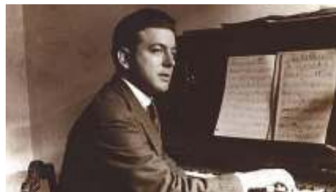
Fig. 6. Jacinto Guerrero [Actualizada el 13/11/2017]. Acceso el 07/10/2017.

VENANCIO Fue en Bailén COBIJÁS ¡Ay, qué bien! VENANCIO Fue en Bailén donde tuve más suerte. Fue en Bailén. COBIJÁS ¡Ay, qué bien! VENANCIO Fue en Bailén donde estuve a la muerte. Todo fue. COBIJÁS Dinos ¡qué!