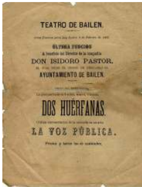
Fig. 1. Teatro de Bailén, cartel de representación zarzuelística en 1882..

Este género es conocido también como género grande, cuando tiene una más extensa duración, frente al chico, generalmente en un acto y de tono popular y costumbrista, en el que también hay ejemplos de zarzuelas. Los estudiosos consideran que las primeras obras del género zarzuelístico son de mediados del siglo XVII y llevan la firma del mis-