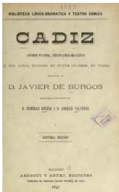
Fig. 3. Portada de la zarzuela Cádiz . (Fuente: Biblioteca Digital Hispánica).

“Fernando. ¿Yo?... (Con explosión de cariño, señalando á Lorenzo). ¿Y el voluntario, entonces, que por la patria combate desde Bailen, soportando todas las penalidades de la guerra?”